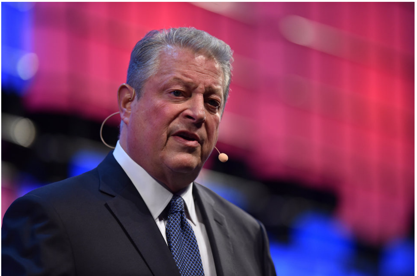
Al Gore al Web Summit nel 2017

Come riporta 24 Ore del 22 maggio scorso, «Il Manifesto... chiede l'introduzione di un'imposta progressiva sui grandi patrimoni, da applicarsi allo 0,1% più ricco dei cittadini italiani, circa 50 mila persone, per la parte di patrimonio netto che eccede i 5,4 miliardi di euro. Il gettito potrebbe arrivare fino a 16 miliardi di euro l'anno... Non si tratta di una "patrimoniale", quanto piuttosto dell'introduzione di tre ulteriori scaglioni ed aliquote marginali Irpef per redditi più elevati». Tra le proposte c'è anche quella dell'aumento del prelievo sulle grandi successioni e donazioni, particolarmente bassa in Italia, e quella dell'abolizione dei regimi sostitutivi, in modo da arrivare a «una tassazione personale omnicomprensiva», che rifletta un sistema fiscale equo, a fronte dell'attuale, che tassa soprattutto i redditi da lavoro, con un maggiore aggravio per i dipendenti».