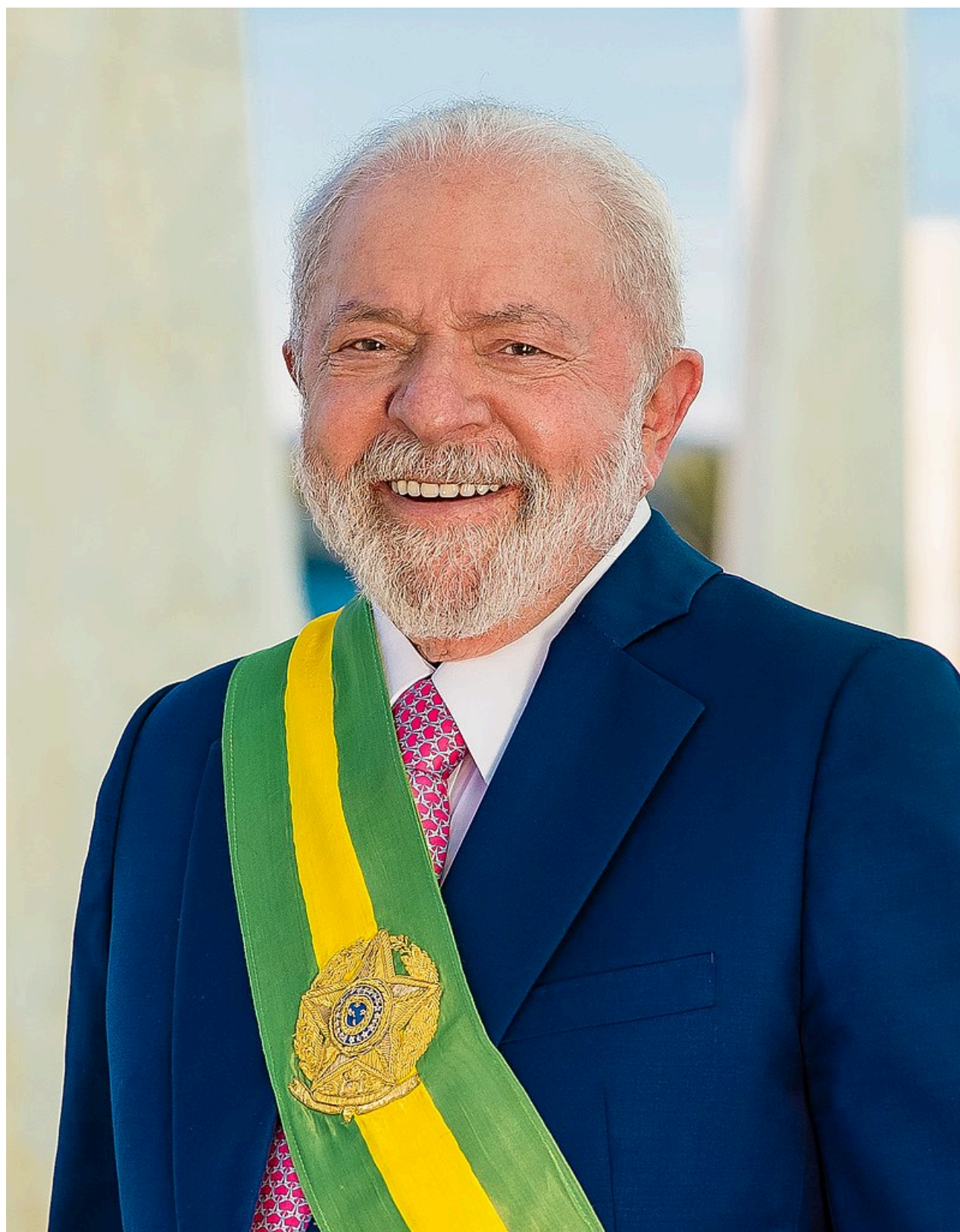
Luiz Inácio Lula da Silva