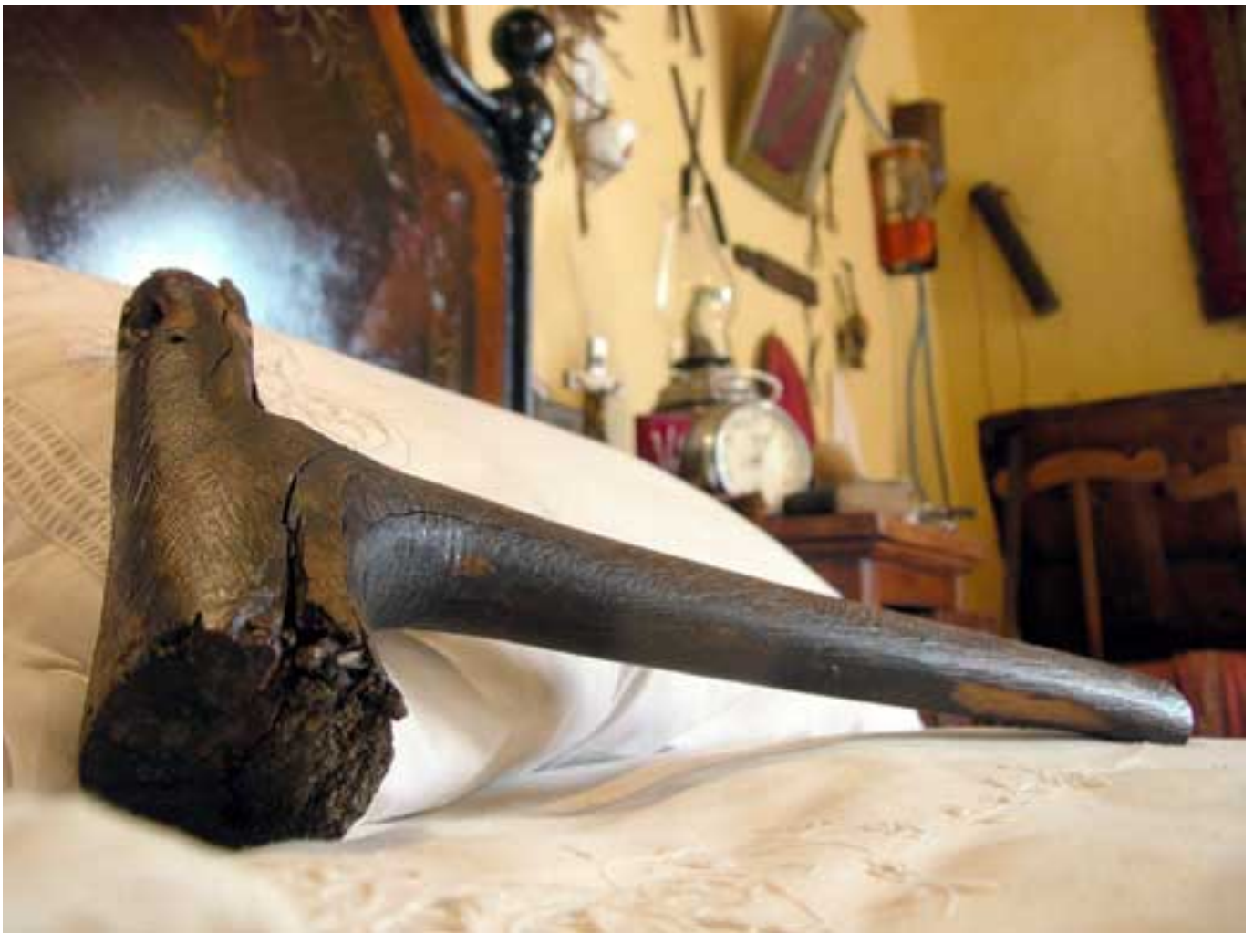
L'esemplare di su mazzolu conservato presso il Museo Galluras a Luras.

Altra pratica dell'accabadora era quella di far spogliare la stanza e il morente di qualsiasi oggetto sacro, medagliette, santini o crocifissi che, attraverso la mediazione e la preghiera dei cari, proteggessero e potessero prolungare il distacco dell'anima dal corpo, motivo per cui essa richiedeva anche che tutti i familiari uscissero dalla stanza. C'è chi legge in questa usanza una contrapposizione palese al cristianesimo. Se dopo queste azioni preliminari la morte non sopraggiungeva, allora e solo dopo aver valutato attentamente le condizioni dell'ammalato, s'accabadora procedeva all'eutanasia. Nella stanza vuota, solo la sacerdotessa della morte e il rendente l'anima al cielo. Erano diverse le modalità che essa poteva utilizzare. Soffocare il moribondo con un cuscino, dargli un colpo secco in un preciso punto del capo, la fronte o la nuca, con una specie di martelletto di legno d'ulivo o d'olivastro ( su mazzolu ), di cui esiste un esemplare conservato presso il Museo etnografico Galluras a Luras, oppure utilizzare il giogo posto sotto la nuca con un colpo che avrebbe dovuto provocare una morte istantanea. È ragionevole pensare che non sempre l'operazione fosse veloce e indolore e che talvolta all'agonizzante sfuggisse un lamento. Ed è probabilmente legato a questa circostanza un detto sardo che suona così: " su ohi de s'accabadore ", cioè "l'ohi provocato dall'accabadora".