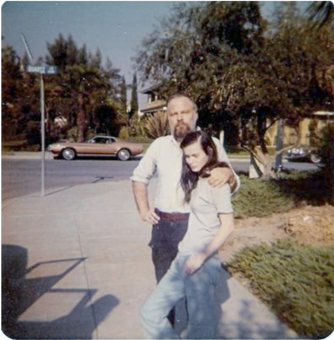
Philip K. Dick