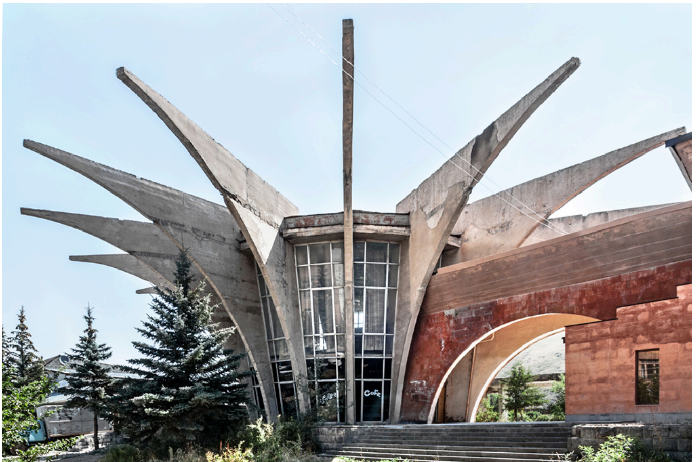
Stazione degli autobus abbandonata, di Henrik Arakelyan (1978). Hrazdan, Armenia

Ho deciso di presentare 26 immagini unite dall'utilizzo di un materiale rigoroso e al contempo plastico come il cemento. Le foto esaltano sia le forme massicce e concretamente fisiche delle architetture rappresentate, sia l'effetto di straniamento quasi metafisico che esse stesse provocano. Tutte le immagini, molte delle quali sono esempi di brutalismo o modernismo socialista, presentano questo modo particolare e sicuramente potente di concepire la costruzione stessa. Ci saranno esempi che, pur nella loro diversità, hanno molto in comune: dall'Italia alla Germania, dal Portogallo alla Moldavia, ma anche da Francia, Svizzera, Turchia, Russia, da paesi caucasici come Georgia e Armenia fino a un dialogo a distanza strutture di New York e di Belgrado. Sono molto contento di poter esporre le mie foto al Libra, un posto in cui sono di casa, sia come cliente sia perché ho avuto modo di lavorarci alcuni anni fa. Non solo, una mia foto di una fabbrica italiana abbandonata, fa ora da fondale di ben 12 metri del bancone del Libra, che è stato rinnovato in tempi recentissimi.