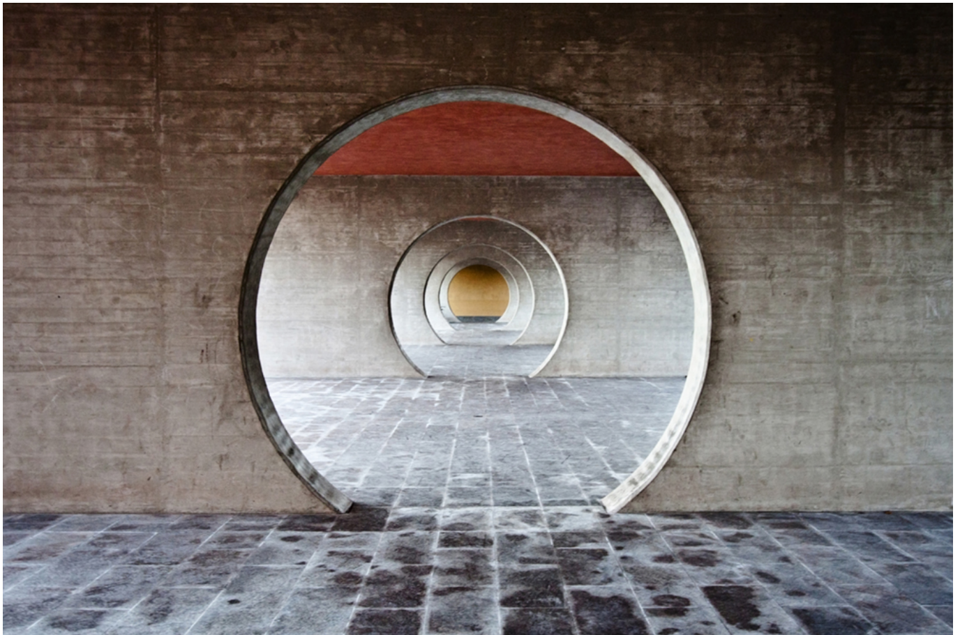
Edificio residenziale, di Mario Botta (1997). Novazzano, Svizzera

Ho sempre amato tutta la musica dark: diciamo che sono cresciuto a pane e Joy Division . Ma oltre a loro, che però non utilizzavano immagini di luoghi abbandonati, ascoltavo generi musicali di nicchia che mi affascinarono molto proprio per le loro ambientazioni, innanzitutto sonore ma anche iconografiche, molto legate ai luoghi abbandonati. Tra questi il più influente per me è stato il progetto musicale svedese Raison d'être , che ha poi pubblicato due dischi utilizzando delle mie foto nell'artwork.