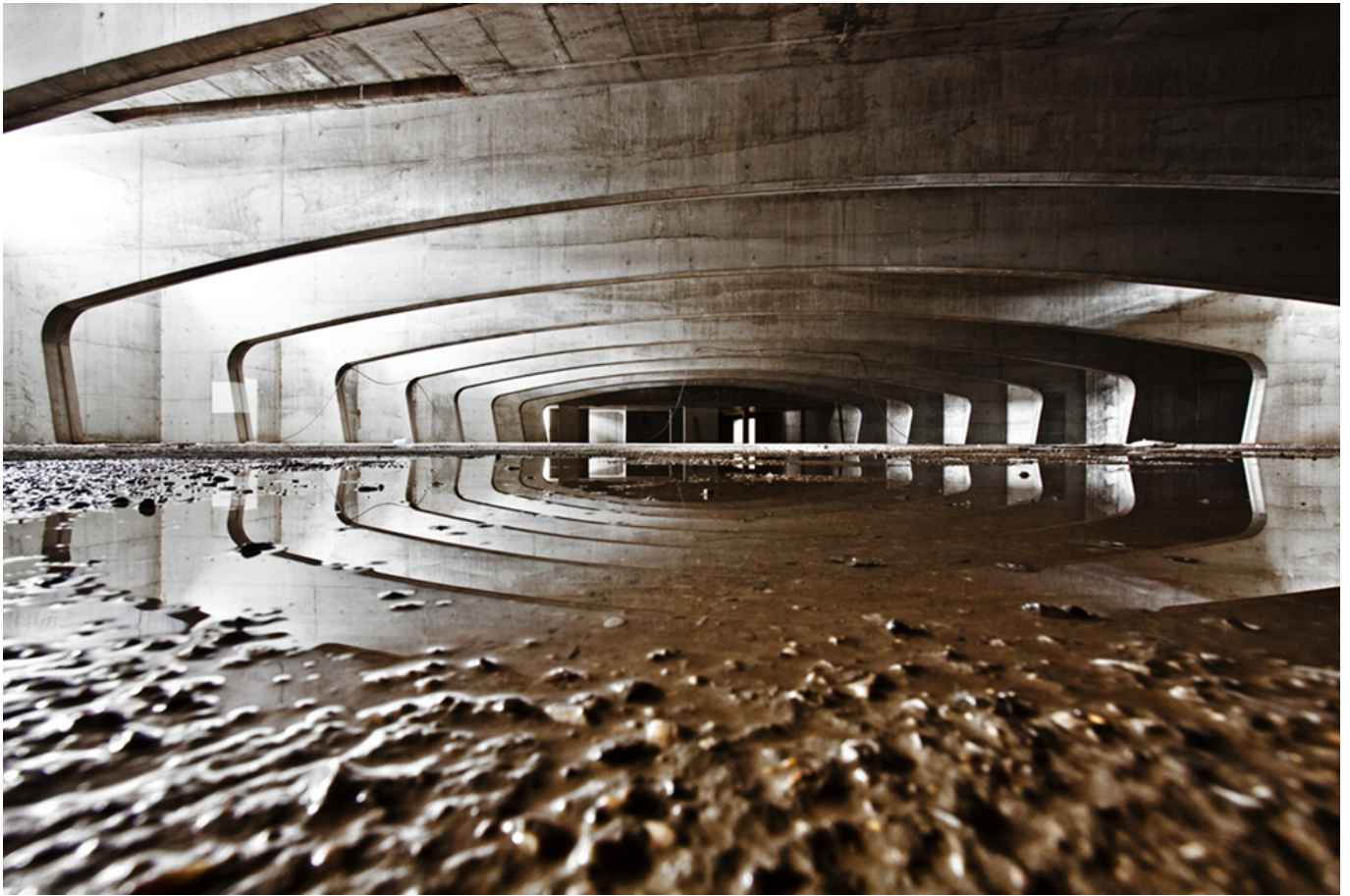
Città dello Sport, di Santiago Calatrava (iniziato nel 2005 e mai concluso). Roma, Italia

Non posso dire esattamente dove nasce il desiderio di scoprire ma l'ho sempre avuto e da quando mi occupo di fotografia è come se avessi trovato il modo di focalizzarlo