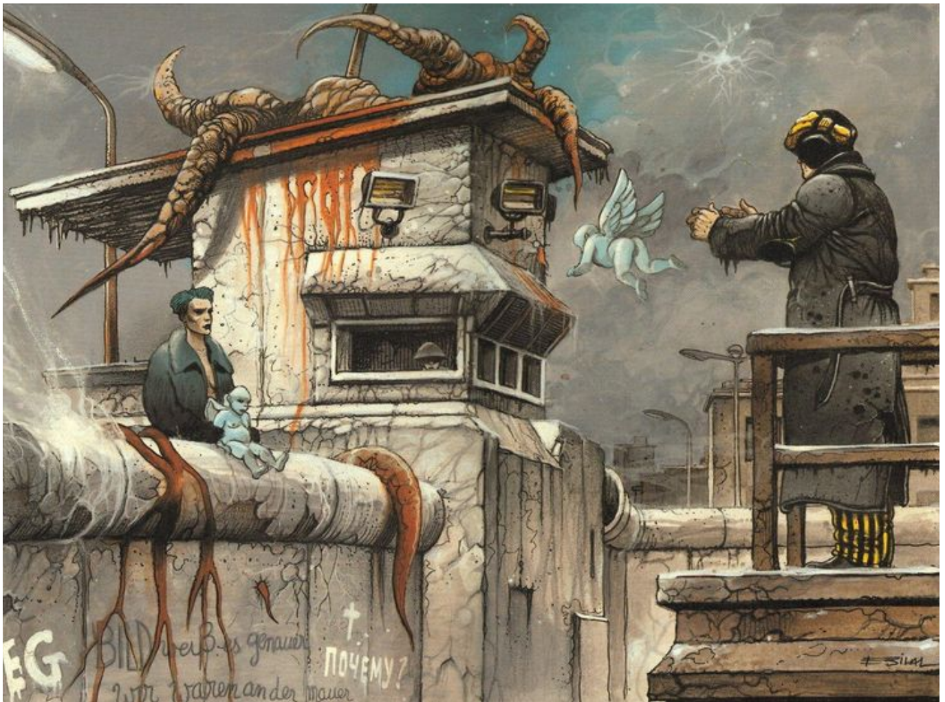
Il muro di Berlino visto dal disegnatore serbo Enki Bilal