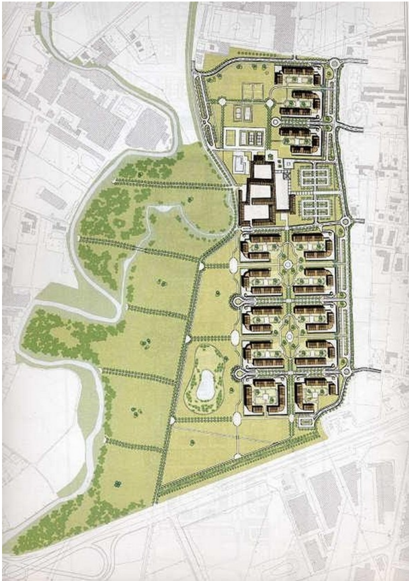
Il piano di lottizzazione della Cascinazza per 388.000 mc