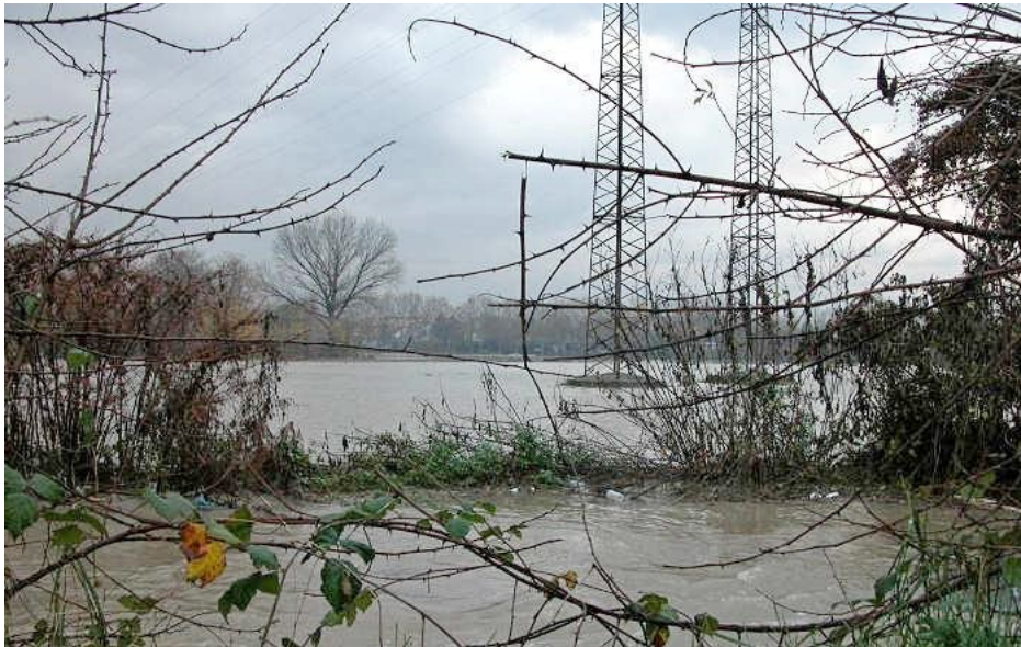
L'esonazione del Lambro del 2002 alla Cascinazza

urbanistici. Affrontiamo la prima questione: il PAI. Nel 2001 era stato approvato un importante atto di tutela fluviale contro le piene del Lambro, che poneva alcuni limiti all'edificazione con fasce di protezione del fiume lungo tutto il suo corso, dai laghi di Pusiano fino al Po. Per Monza le tutele riguardavano alcune zone del Parco Reale, il centro storico, ma anche le aree agricole della Cascinazza, poste più a sud.