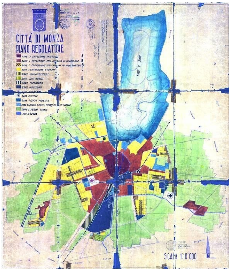
Il Piano Regolatore del 1949

Mercoledì, 14 Aprile 2021 16:52 Di Giorgio Majoli