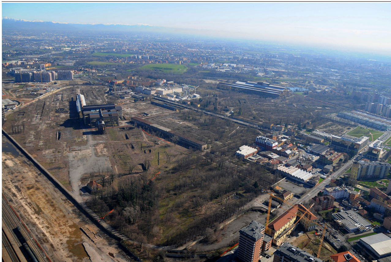
Area dismessa ex-Falk - Sesto San Giovanni

Venerdì, 05 Giugno 2020 18:18 Di Giacomo Correale Santacroce