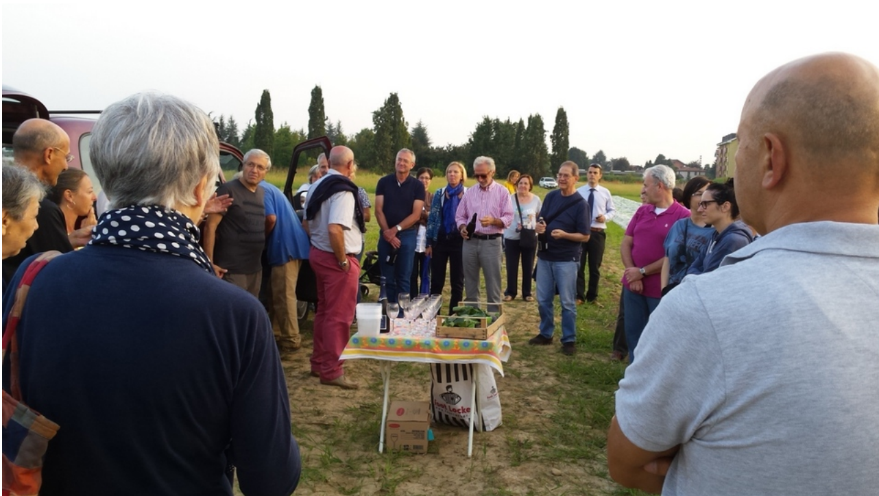
Inaugurazione dell'orto sociale della Comunità Agricola del cibo ad Agrate , 2015

Molte sono attualmente nel nostro Paese le proposte di legge dirette a regolare l'uso del suolo libero. Ma un'ottima base di partenza per una discussione proficua mi sembra essere la proposta di legge popolare presentata dal Forum "Salviamo il Paesaggio" il 31 gennaio 2018 (DdL AS 164), per quattro ragioni: 1. Perché propone esplicitamente la cessazione del consumo del suolo dal momento dell'approvazione della legge, senza dilazioni; 2. Perché la proposta è avanzata da un'ampia schiera di uomini di cultura, esperti e operatori di alto livello e rappresentanti di diverse organizzazioni della società civile (urbanisti, paesaggisti, architetti, giuristi, naturalisti, economisti, agroforestali, geologi...); 3. Perché la proposta si basa su una rigorosa ricerca sul problema del consumo di suolo; 4. Perché, last but not least , essa consiste in soli 10 articoli, redatti in buon italiano, senza garbugli e rinvii ermetici ad altre leggi, comprensibile per un cittadino di media cultura: tutte cose essenziali per una legislazione efficiente e democratica, che è alla base di una delle riforme più invocate, spesso solo a parole: quella della Pubblica Amministrazione.