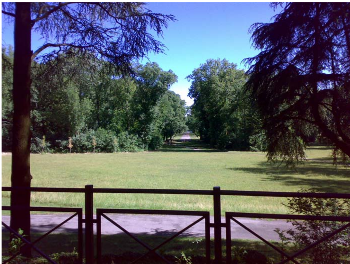
La prospettiva del Viale Mirabello dal Belvedere della Valle dei Sospiri

Lunedì, 20 Giugno 2011 01:00 Di Giacomo Correle Santacroce e Giorgio Majoli