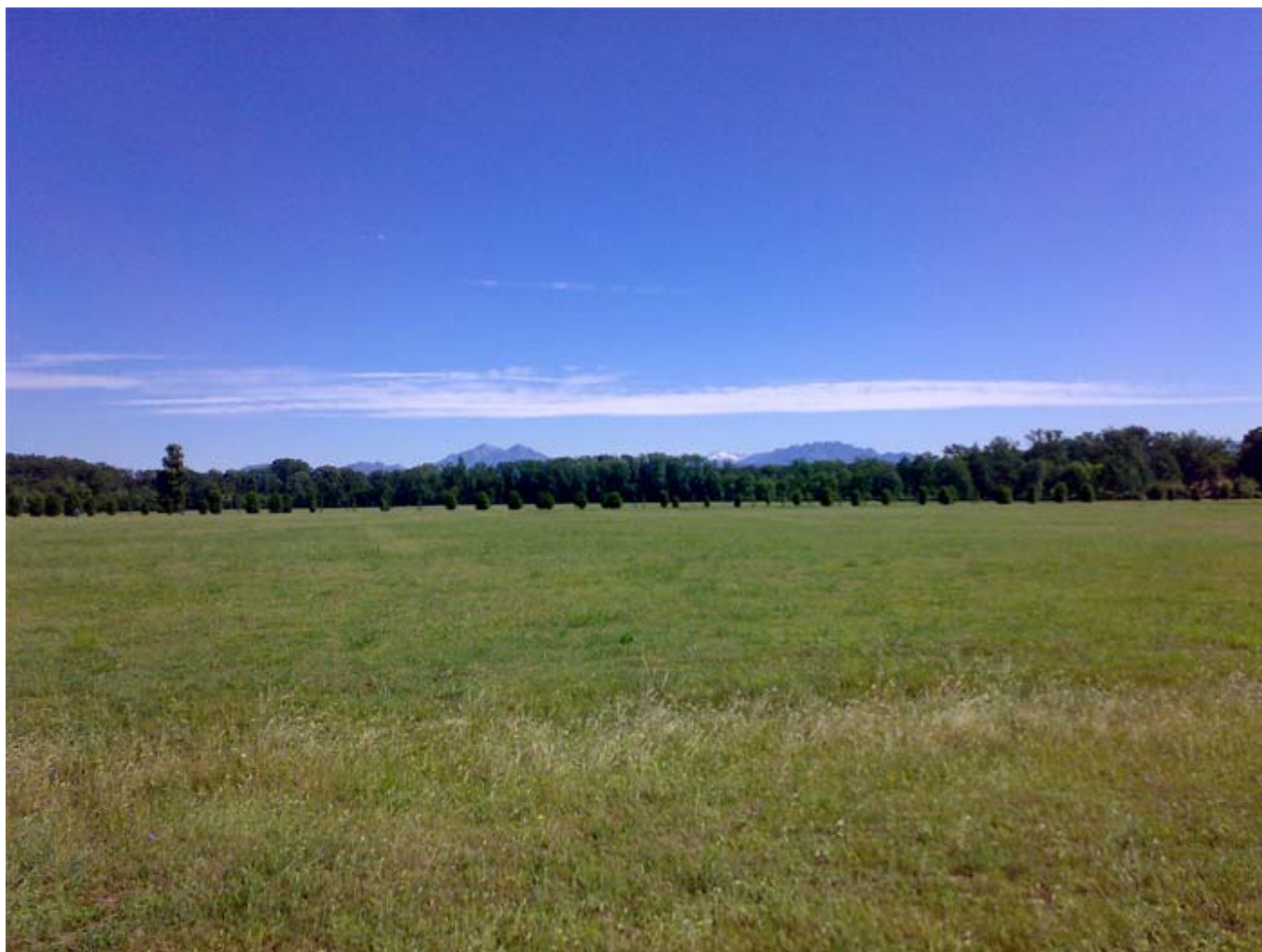
Vista della Grigna e del Resegone dal Prato del Mirabello