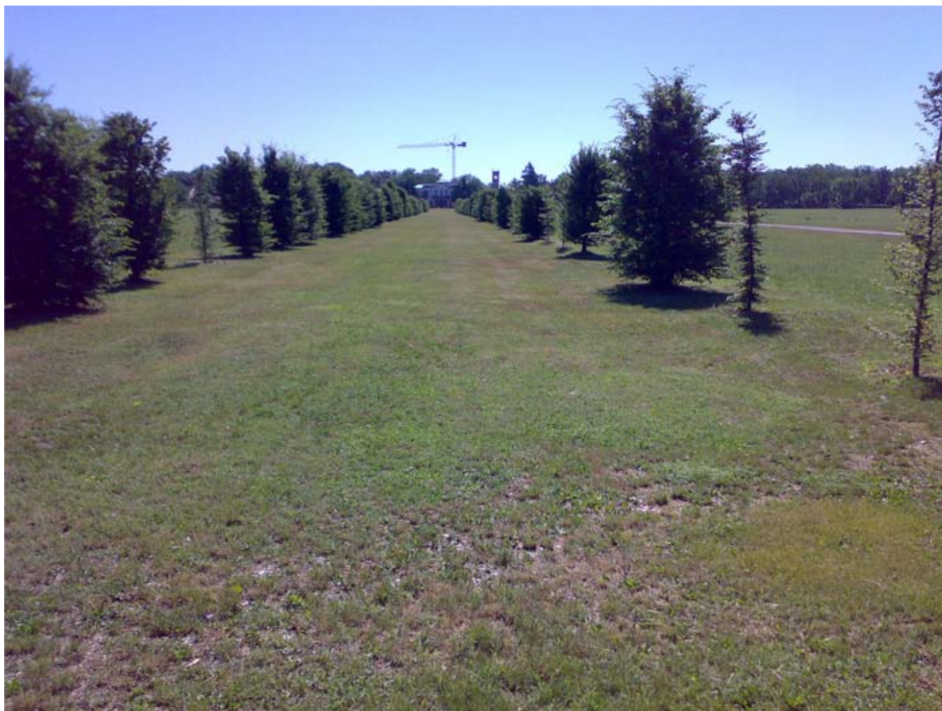
Il viale dei Carpini tra la Villa Mirabello e la Villa Mirabellino

Lunedì, 20 Giugno 2011 01:00 Di Giacomo Correle Santacroce e Giorgio Majoli