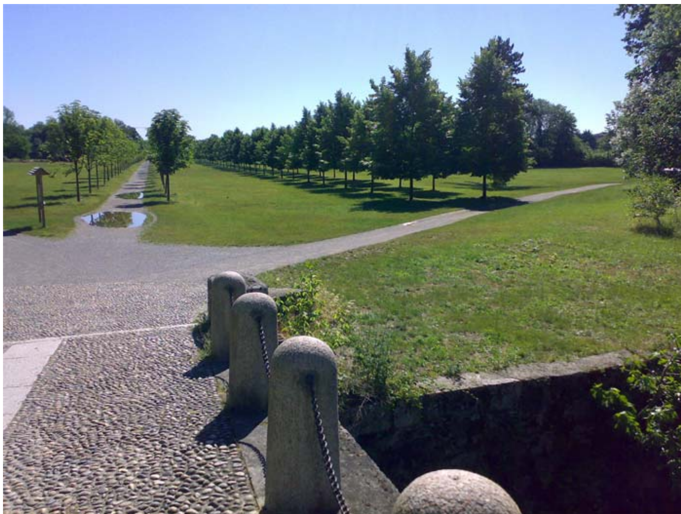
Vista dal viale dei tigli e degli ippocastani dal ponte delle catene

Lunedì, 20 Giugno 2011 01:00 Di Giacomo Correle Santacroce e Giorgio Majoli