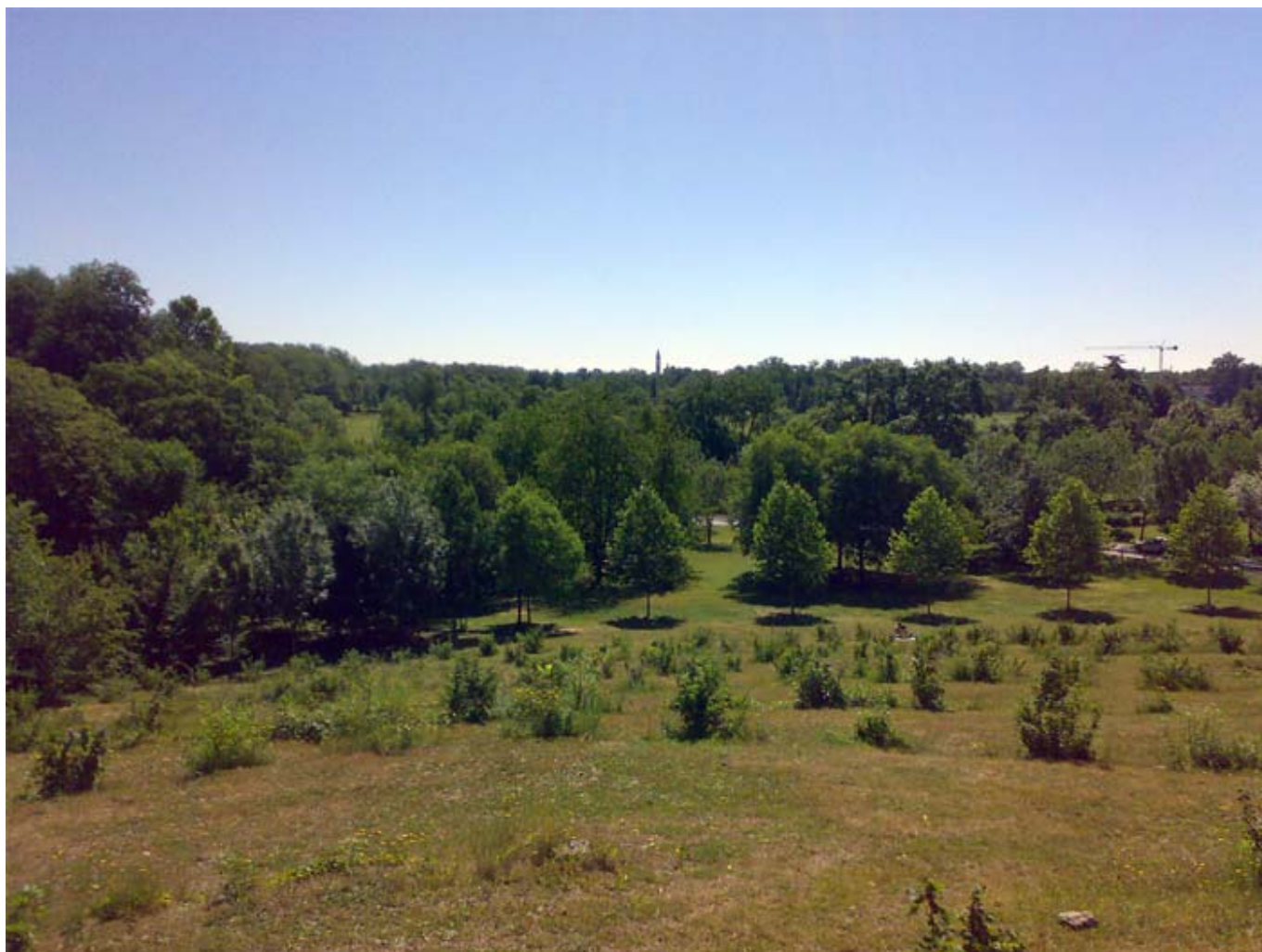
Vista del Parco dal Belvedere della Montagnola di Vedano

Lunedì, 20 Giugno 2011 01:00 Di Giacomo Correle Santacroce e Giorgio Majoli