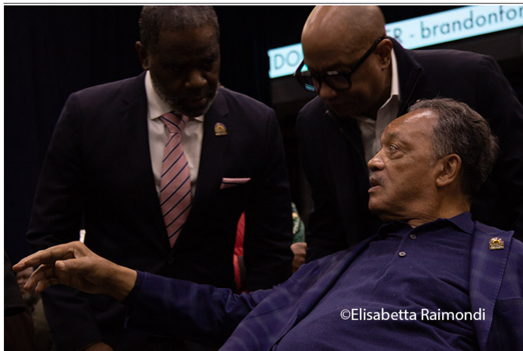
Jesse Jackson sotto il palco del palazzetto dello sport che ha ospitato l'evento del 30 marzo per Brandon Johnson