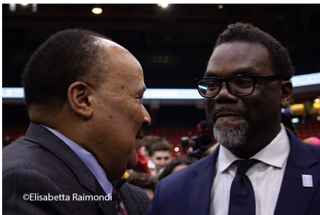
Martin Luther King terzo e Brandon Johnson