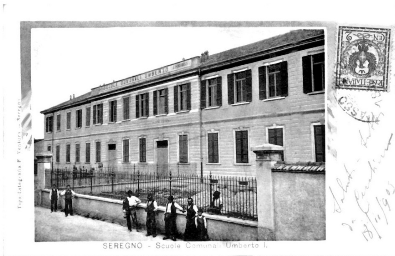
Cartolina d'epoca della scuola comunale Umberto I di Seregno, poi trasformata in uffici comunali

Eppure, sono possibili letture più inclusive della scuola autonoma come scuola del territorio, espressione della comunità del luogo, scuola gestita, sulla base del principio di sussidiarietà, dall' "autorità territorialmente e funzionalmente più vicina ai cittadini interessati" (legge n. 59 del 1997). L'esperienza del sistema scolastico del Regno Unito dimostra che ciò è possibile.